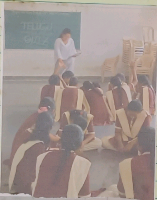
Telugu Activity 2021