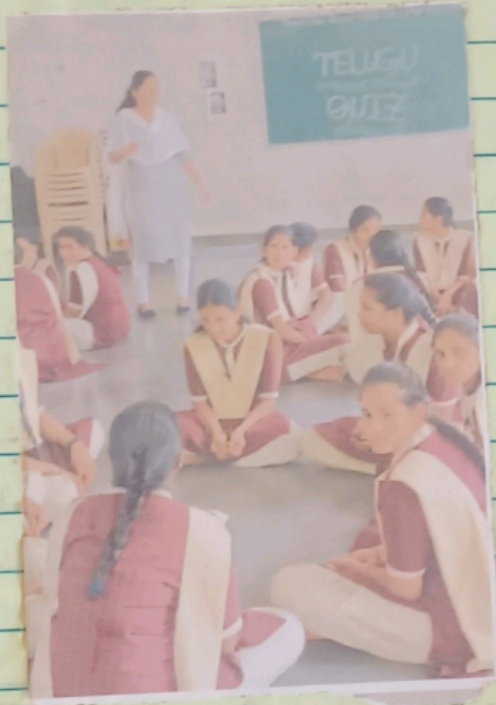
Telugu quiz Activity 2019